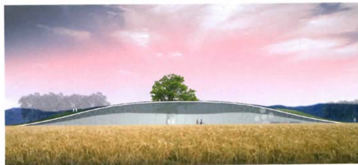
Nuova sede della Croce Rossa Italiana – Pesaro 2007