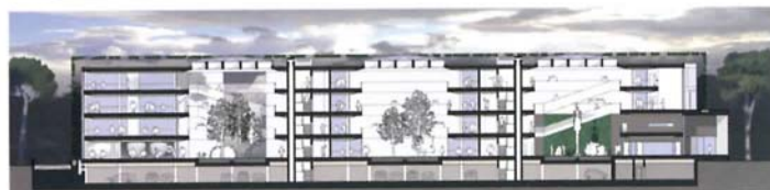
Nuova sede della Provincia di Arezzo – Arezzo 2005